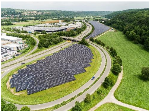
Solarpark Traufwiesen; Bild: swt