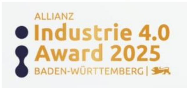
Logo: Allianz Industrie 4.0 Award

Nutzen Sie jetzt die Gelegenheit, sich selbst oder herausragende Ausbilderinnen und Ausbilder Ihres Unternehmens für den Landesausbilderpreis 2025 vorzuschlagen. Der Preis würdigt Personen, die sich mit ihrem Engagement in der beruflichen Bildung besonders hervorgetan haben. Er wird vom Ministerium für Wirtschaft, Arbeit und Tourismus Baden-Württemberg in Zusammenarbeit mit dem Handwerkstag BW, dem Industrie- und Handelskammertag des Landes (BWIHK) sowie dem Landesverband der Freien Berufe (LFB) vergeben. Bewerbungsschluss ist der 31. Januar. https://landesausbilderpreis.gut-ausgebildet.de/