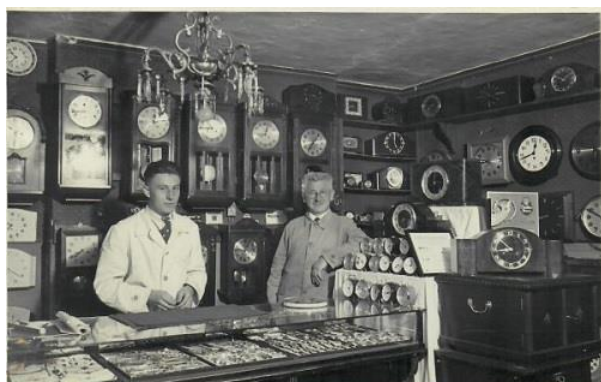
Bild: Gründer Otto Schott mit seinem Sohn Otto jun.