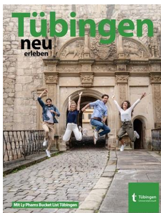
Bild: Tübingen neu erleben

Nach 15 Jahren gibt es eine Neuauflage des Tübinger MONOPOLYs. Es wurde Ende November im Boxenstop Museum vorgestellt. Neben den altvertrauten Straßen finden sich auch bekannte Sehenswürdigkeiten, Orte und Unternehmen aus der Universitätsstadt auf dem Spielbrett. Wie beim klassischen MONOPOLY geht es darum, Grundstücke zu erwerben. Besonders bei der Tübinger Edition ist allerdings, dass auch eine Spätzle- und eine Maultaschensteuer erhoben werden. Das Spiel gibt es in der Tourist Information an der Neckarbrücke und bei Osiander: https://www.osiander.de/shop/home/artikeldetails/A1072427119