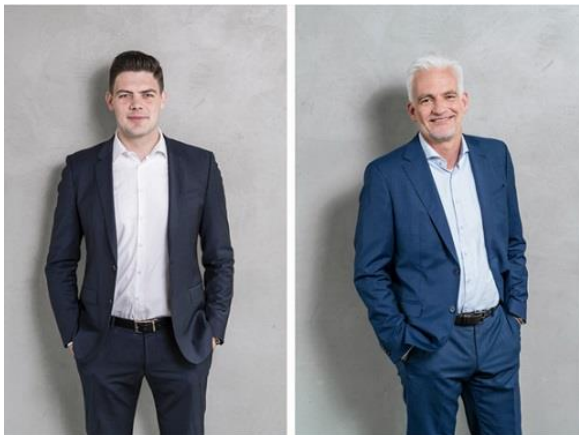
L. Maucher/ H. Leonhardt; Bild: SHS