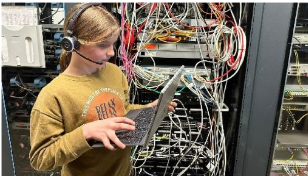
Bild: Girls' Day