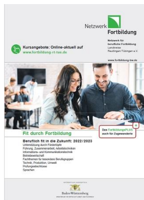
Grafik: Netzwerk Fortbildung