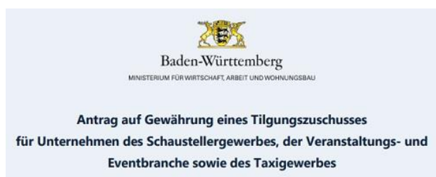
Bild: Antragsformular Ministerium für Wirtschaft, Arbeit und Wohnungsbau Baden-Württemberg