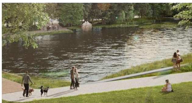
Bildausschnitt: bhm Planungsgesellschaft/Filon Leipzig