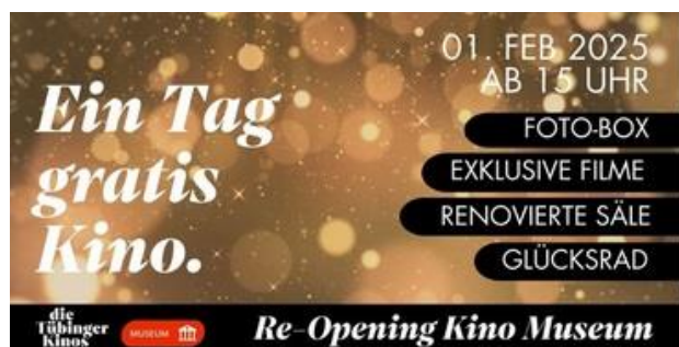
Bild: die Tübinger Kinos