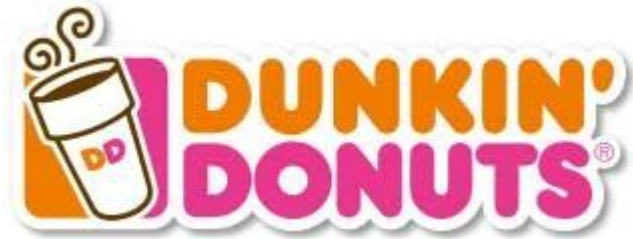
Logo: Dunkin' Donuts