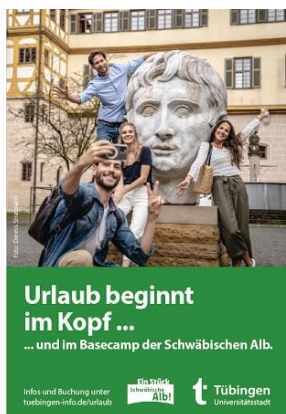
Anzeige im MERIAN Schwäbische Alb

Voraussichtlich am 21. Dezember erscheint das neue Magazin „Schwäbische Alb“ von Merian. Darin ist Tübingen mit redaktionellem Text und Anzeige prominent vertreten. Im Heft geht es um die Mittelgebirgsregion zwischen Tübingen und Ulm, Neckar und Donau als Erholungs- und Erlebnislandschaft für Aktive und Genussmenschen. https://www.merian.de/