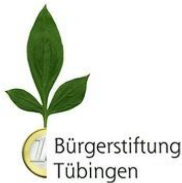
Logo: Bürgerstiftung Tübingen