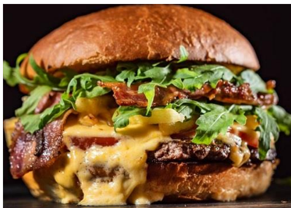
Bildausschnitt: Hills Burger Club