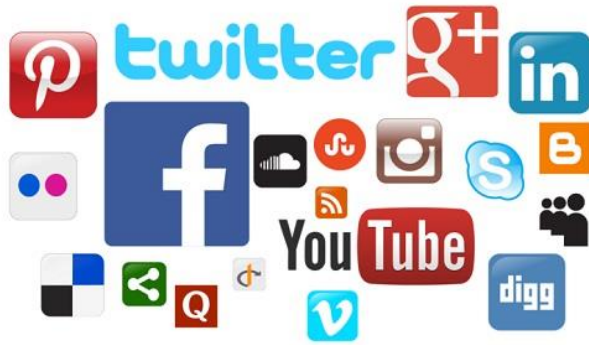
Grafik: Wikimedia / Ibrahim.ID