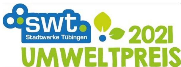
Logo: swt Umweltpreis