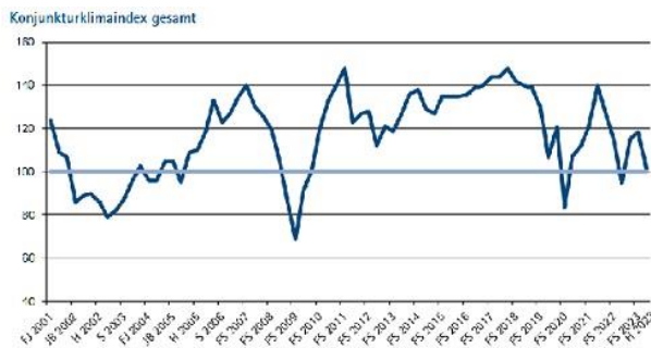
Grafik: IHK Reutlingen