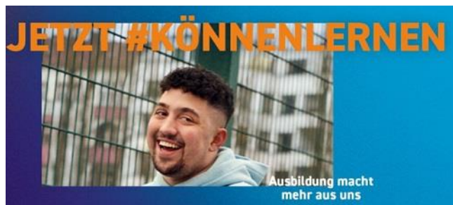
Grafik: jetzt #könnenlernen