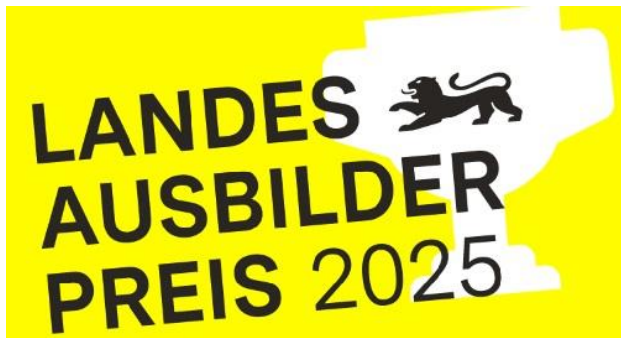
Grafik: Wirtschaftsministerium BW