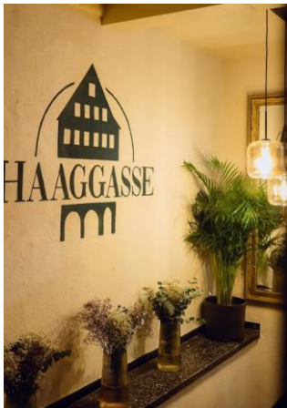
Bild: Haaggasse 31