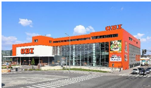
OBI-Markt in Wien.