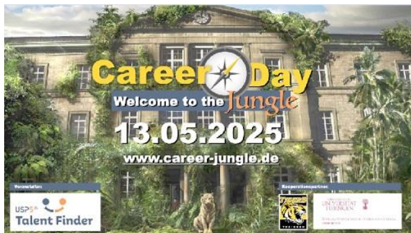
Bild: Career Day