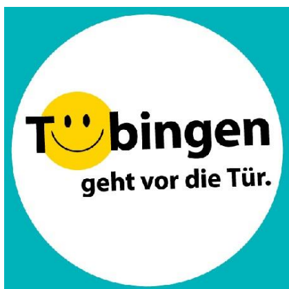
Logo: Tübingen geht vor die Tür

Auch wenn er bei Redaktionsschluss schon ausgebucht war, möchten wir doch den 20. Tübinger Abendspaziergang nicht unerwähnt lassen, der am 13. März unter dem Motto „Im Westen nichts Neues? Oh doch!“ stattfindet. Der von WIT und HGV organisierte Abend bietet einen Blick hinter die Kulissen von Café OONIKAT in der Schmiedtorstraße, Mohr Optik in der Ammergasse, FRAU ANNE Süßes & Schleck im Schleifmühlweg und Kornblumen Kunst & Kultur in der Haaggasse. www.tuebingen-abendspaziergang.de