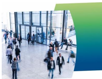
Die größten Unternehmen in Baden-Württemberg