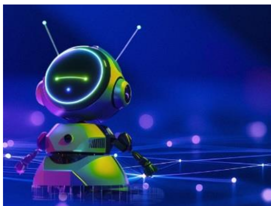
Bild: AI & Automation Day