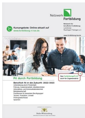
Grafik: Netzwerk Fortbildung