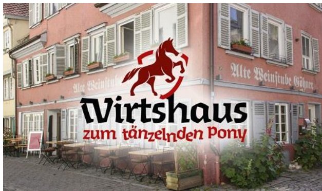
Bild: Wirtshaus zum tänzelnden Pony