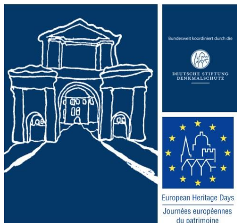
Grafik: Universitätsstadt Tübingen