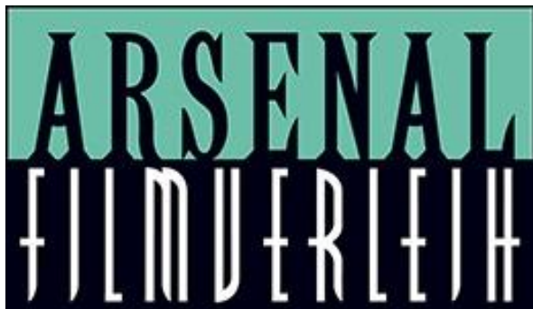
Logo: Arsenal Filmverleih GmbH