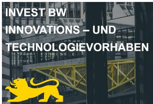
Grafik: Wirtschaftsministerium BW