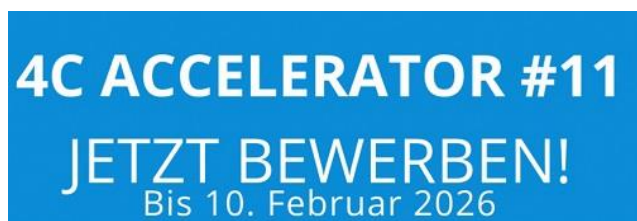
Grafik: 4C Accelerator