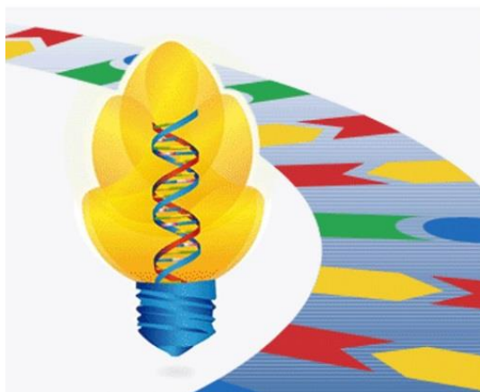
Bild: Innovationspreis BioRegionen 2026