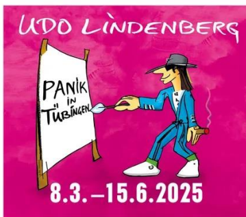
Neues Kunstmuseum Tübingen Schaffhausenstraße 123 · 72071 Tübingen