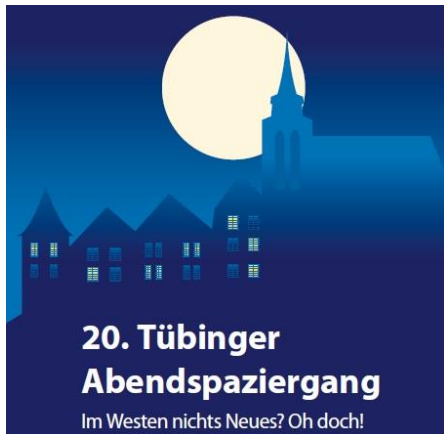
Bild: Tübinger Abendspaziergang

Die Radbrücke West heißt ab sofort „Ann-Arbor-Brücke“. Das beschloss der Gemeinderat in seiner Sitzung am 24. Februar auf Antrag der Fraktionen AL/GRÜNE und CDU. Damit findet sich nun auch unsere US-Partnerstadt in den Benennungen von Tübinger Plätzen, Straßen und Orten, was bisher nicht der Fall war. Ann Arbor hat bereits mehrere Orte nach Tübingen benannt, darunter den „Tuebingen Bike Park“. https://www.tuebingen.de/europaplatz/31621.html