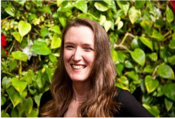
Pia Klein