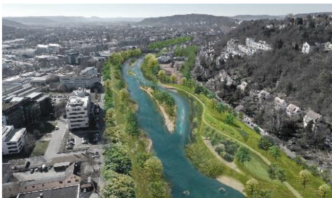
Visualisierung: Geitz und Partner