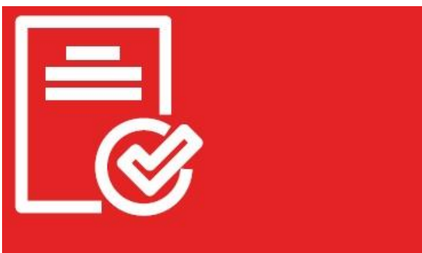
Grafik: Landkreis Tübingen