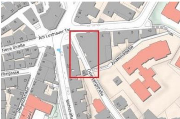
Kartenausschnitt: Universitätsstadt Tübingen/swt