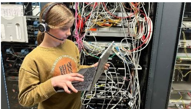
Bild: Girls' Day