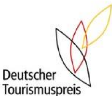
Logo: Deutscher Tourismuspreis