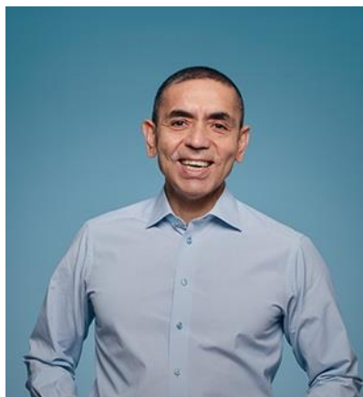
Bild: BioNTech-CEO Ugur Sahin