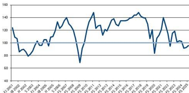
Grafik: IHK Reutlingen