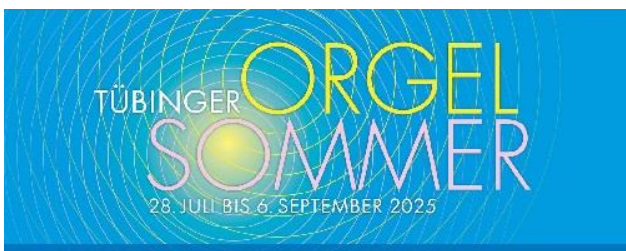
Grafik: Stiftskirche Tübingen