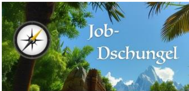
Grafik: Job Dschungel