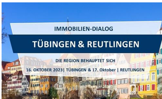
Grafik: Heuer Dialog GmbH

https://www.tuebingen.de/ausnahmegenehmigung