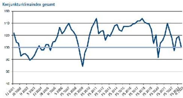
Grafik: IHK Reutlingen