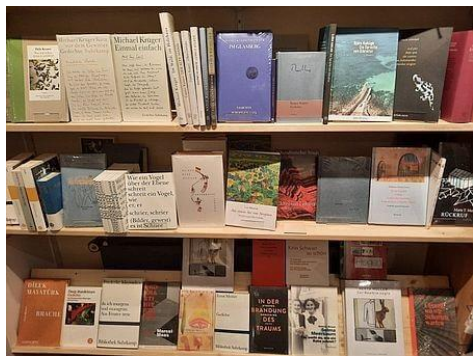
Bild: Lyrikhandlung am Hölderlinturm