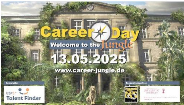
Bild: Career Day