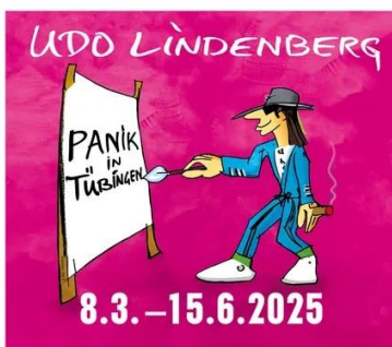
Neues Kunstmuseum Tübingen Schaffhausenstraße 123 · 72071 Tübingen