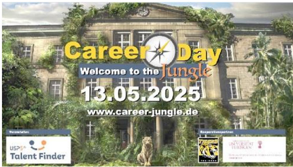
Bild: Tigers Career Day