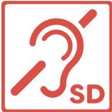
Grafik: Universitätsstadt Tübingen