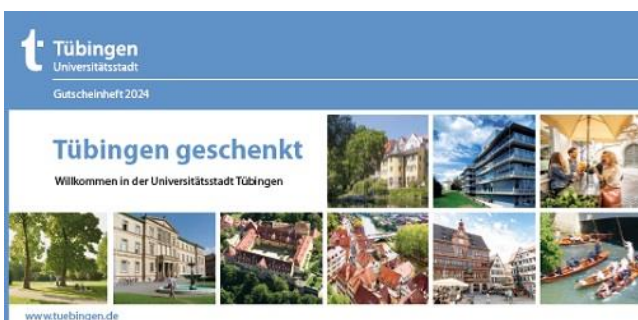
Bild: Gutscheineft 2024