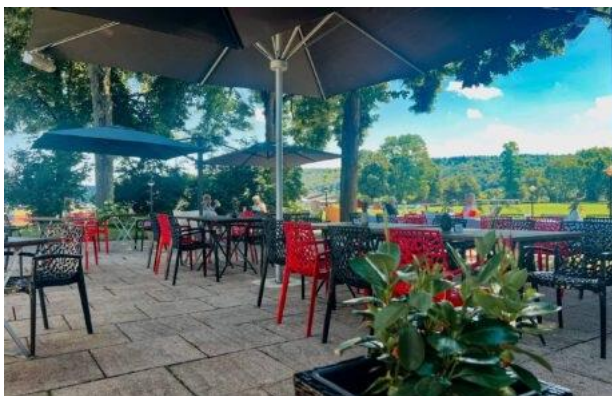
Bild: Restaurant Riva