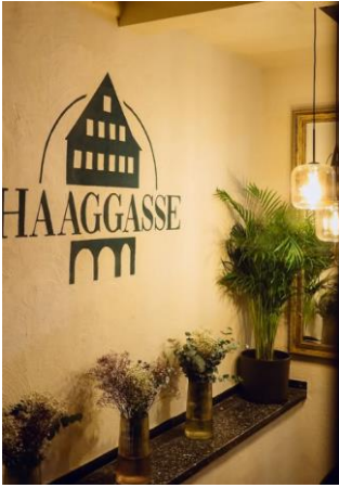
Bild: Haaggasse 31