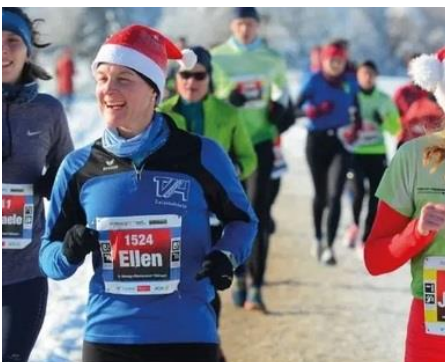
Nikolauslauf