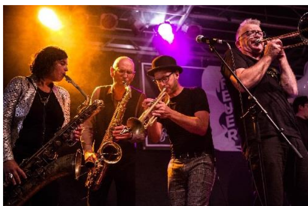
Bild: Louisiana Funky Butts Brassband