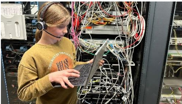
Bild: Girls' Day