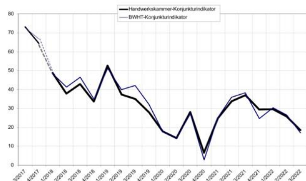
Grafik: Handwerkskammer Reutlingen

Das regionale Handwerk richtet sich auf schwierige Monate ein. Jeder fünfte Betrieb, und damit doppelt so viele wie im Vorjahr, rechnet mit einer schlechteren wirtschaftlichen Lage. Sorgen bereitet vor allem der beschleunigte Preisanstieg bei Material, Rohstoffen und Energie. Das geht aus der Konjunkturumfrage der Handwerkskammer Reutlingen zum dritten Quartal 2022 hervor. Der Konjunkturindikator ging um rund 18 Punkte gegenüber dem Vorjahresquartal zurück. https://www.hwk-reutlingen.de/konjunktur