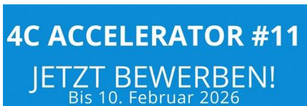
Grafik: 4C Accelerator