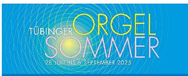
Grafik: Stiftskirche Tübingen