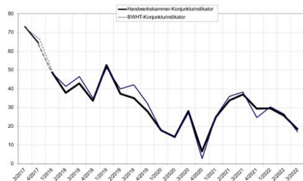
Grafik: Handwerkskammer Reutlingen

https://www.hwk-reutlingen.de/konjunktur