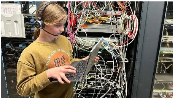
Bild: Girls' Day