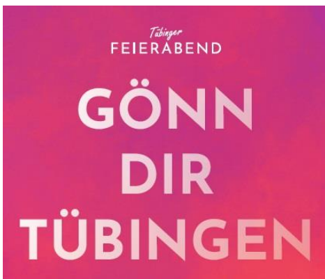
Grafik: Tübinger Feierabend

Der vorläufige Abschlussbericht zum Tübinger Modellversuch „Öffnen mit Sicherheit“ wurde am 11. Mai dem Sozialministerium übergeben. Der Bericht bescheinigt eine weitgehende wirtschaftliche Tragfähigkeit des Modells. So verzeichnete etwa die Außengastronomie bei schönem Frühlingswetter mit Tagestouristen hervorragende Umsätze. Mit einer Plakataktion in den Schaufenstern haben sich Betriebe des Handels, Gewerbes und der Gastronomie bei den Initiatoren des Tübinger Modellprojekts bedankt. https://www.tuebingen.de/modellversuch