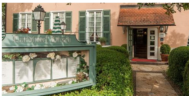
Bildausschnitt: Hirsch Bebenhausen

https://www.koncepthotels.com/neue-horizonte-tuebingen/