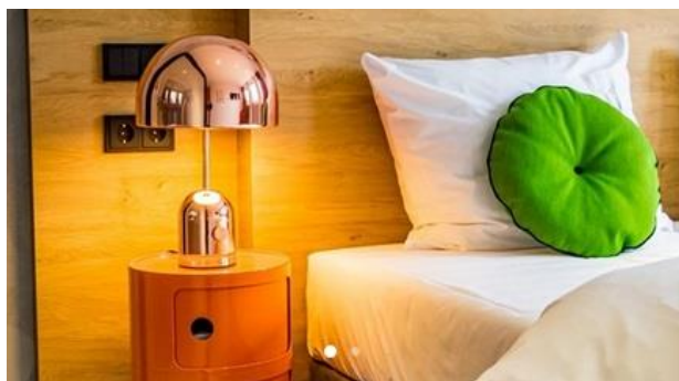
Bild: Konzept Hotel Neue Horizonte

https://www.tuebingen.de/stadtmuseum/32509.html