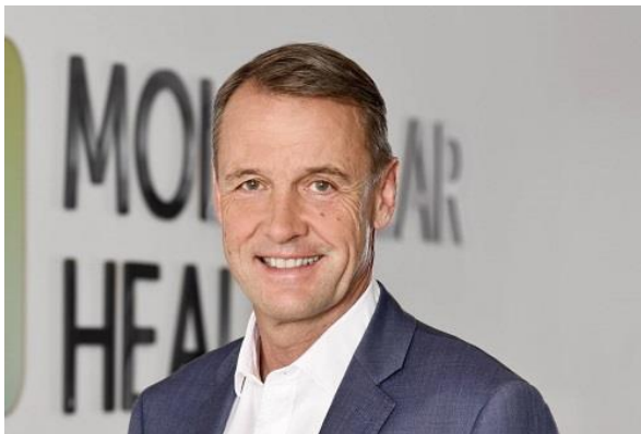
Friedrich von Bohlen und Halbach