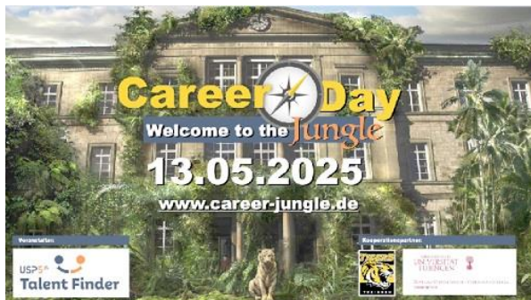
Bild: Tigers Career Day