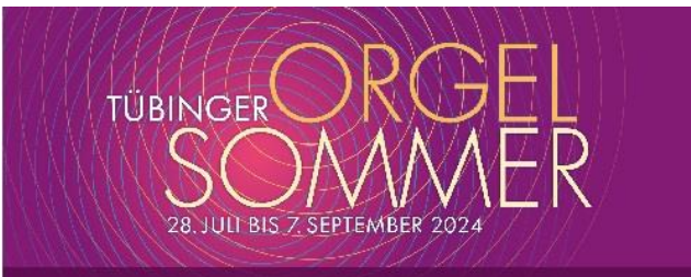
Bild: Stiftskirche Tübingen

https://www.tuebingen.de/kennen-sie-tuebingen