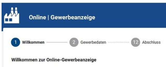
Grafik: Universitätsstadt Tübingen