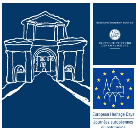
Grafik: Universitätsstadt Tübingen