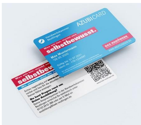
Grafik: HWK Reutlingen/ Mockups Design

Im Rahmen des monatlich stattfindenden Gründer-Meetups des Neckar Hubs wird am 30. Juli um 16 Uhr das neue „Coworking Café“ im Shooter Stars (Wilhelmstraße 16) in Tübingen eröffnet. Das Coworking Café öffnet seine Pforten offiziell am 1. August von 10 bis 18 Uhr für Coworking-Interessierte. Gebucht wird beim Neckar Hub zu den üblichen Preisen. Kontakt: s.mueller@neckar-hub.com http://neckar-hub.com/