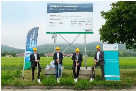
Der Spatenstich erfolgte Mitte Juni.