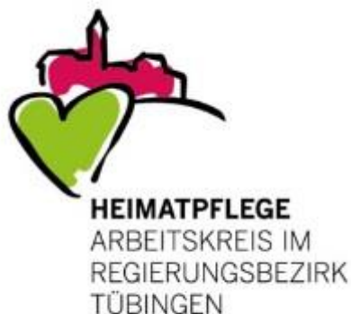
Logo: Arbeitskreis Heimatpflege

Dorfgasthäuser sind ein wichtiger Bestandteil unserer lebendigen Heimat. Um ihre Bedeutung für das Gemeinwesen in das öffentliche Bewusstsein zu rücken, schreibt der Arbeitskreis Heimatpflege im Regierungsbezirk Tübingen e.V. den Wettbewerb „Vorbildliches Dorfgasthaus“ aus. Ziel ist es, Dorfgasthäuser im Regierungsbezirk als lebendige Begegnungsstätte auszuzeichnen. Bewerbungen nimmt die Geschäftsstelle des Arbeitskreises bis zum 25. Juli entgegen. https://rp.baden-wuerttemberg.de/fileadmin/RP-Internet/Tuebingen/ DocumentLibraries/PresseAnhang_neu/23-05-30_Ausschreibungstext_2023.pdf