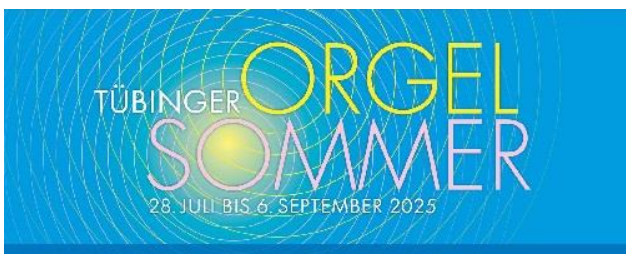
Grafik: Stiftskirche Tübingen