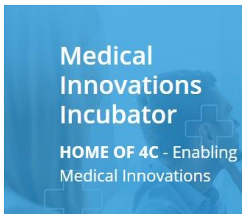
Grafik: Medical Innovations Incubator GmbH