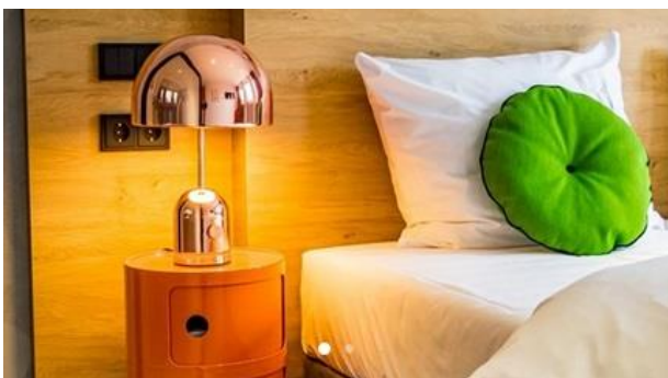
Bild: Konzept Hotel Neue Horizonte

https://www.koncepthotels.com/neue-horizonte-tuebingen/