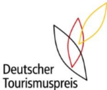
Grafik: Deutscher Tourismuspreis