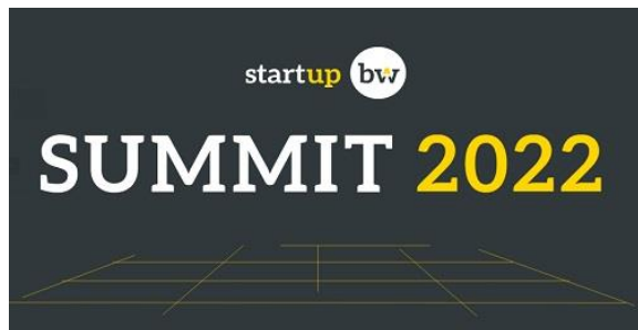
Bild: Start-up BW Summit 2022

Mehr als 20 Startups aus den medizinischen Life Sciences wurden bislang mit dem 4C Accelerator Tübingen und dem für die Rudolf-Diesel-Medaille nominierten Förderkonzept erfolgreich unterstützt – und es soll weitergehen! Gefördert wird das Programm durch die Kampagne „Start-Up BW“ des Wirtschaftsministeriums Baden-Württemberg, der Stiftung für Medizin-Innovationen und der B. Braun Stiftung. Bewerbungsschluss ist am 22. Juli. https://mi-incubator.com/en/4c-accelerator-tuebingen/?utm_medium=Mailing&utm_campaign=Announcement+4C+Q1-22