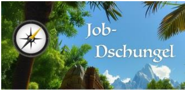
Grafik: Job Dschungel