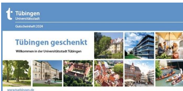
Bild: Gutscheineft 2024