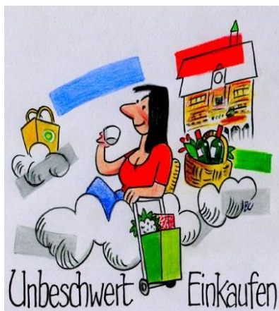
Bild: Unbeschwert einkaufen