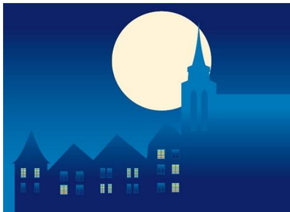
Bild: Tübinger Abendspaziergang